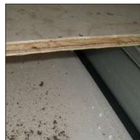
Underlayment op Combifor ligger

Note: Voor meer vloerdetails, raadpleeg het Combifor