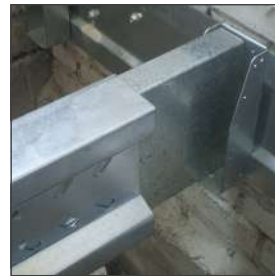
Muurprofiel, schuifstuk en ligger