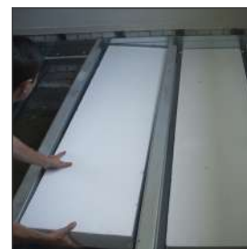
Aanbrengen EPS isolatie