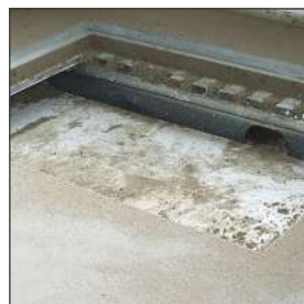
Zwaluwstaartplaat + zand-cement