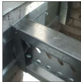
Muurprofiel met haakbeugel

Zowel in droogbouw als universele uitvoering is de vloer snel op temperatuur en houdt deze vast. Bij vloerverwarming wordt het rendement positief beïnvloed door de uitstekende geleiding van het metaal, waardoor de warmte optimaal spreidt.