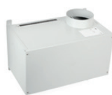
Wand plenum 8 aansluitingen