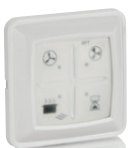
RFT Zender DF