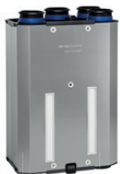
HRU ECO 300 warmteterugwinunit