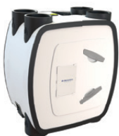
HRU ECO 350 warmteterugwinunit