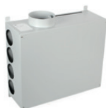
Wand plenum 12 aansluitingen