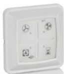
RFT Auto zender