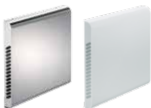
Het externe wandpaneel is optioneel verkrijgbaar in RVS of plastic.