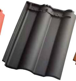
leikleur mat engobe