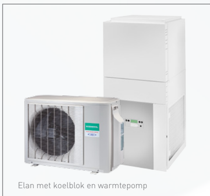
Elan met koelblok en warmtepomp