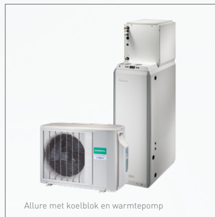
Allure met koelblok en warmtepomp